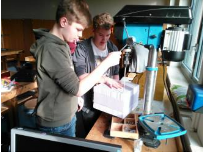
DF80E, Stand 21.02.2018

Das Gehäuse wurde weiter bearbeitet. Es bekommt 4 hölzerne Stäbe an den Ecken, die es mechanisch stabilisieren und die als Aufhängepunkte für den darüberliegenden Fallschirm und auch für darunterhängende weitere Nutzlast dienen sollen. Wir haben die Stäbe bereits zugesägt und die Styrodurteile (die natürlich nicht auf Anhieb alle die richtige Größe hatten) entsprechend angepasst. Die ersten Teile der Nutzlast wurden bestellt: die Kameras und die SD-Karten...