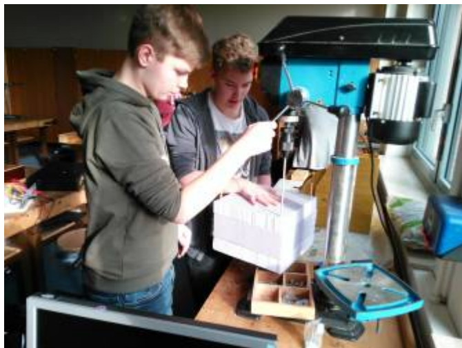
DF80E, Stand 21.02.2018

Das Gehäuse wurde weiter bearbeitet. Es bekommt 4 hölzerne Stäbe an den Ecken, die es mechanisch stabilisieren und die als Aufhängepunkte für den darüberliegenden Fallschirm und auch für darunterhängende weitere Nutzlast dienen sollen. Wir haben die Stäbe bereits zugesägt und die Styrodurteile (die natürlich nicht auf Anhieb alle die richtige Größe hatten) entsprechend angepasst. Die ersten Teile der Nutzlast wurden bestellt: die Kameras und die SD-Karten...