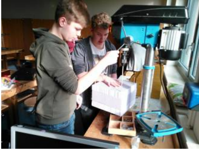
DF80E, Stand 21.02.2018

Das Gehäuse wurde weiter bearbeitet. Es bekommt 4 hölzerne Stäbe an den Ecken, die es mechanisch stabilisieren und die als Aufhängepunkte für den darüberliegenden Fallschirm und auch für darunterhängende weitere Nutzlast dienen sollen. Wir haben die Stäbe bereits zugesägt und die Styrodurteile (die natürlich nicht auf Anhieb alle die richtige Größe hatten) entsprechend angepasst. Die ersten Teile der Nutzlast wurden bestellt: die Kameras und die SD-Karten...