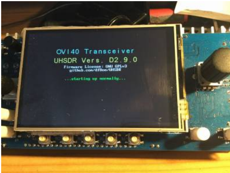
Boot loader splash screen au démarrage du OVI40 UI

Vérifiez aussi que le numéro de version „boot loader“ affiché dans le menu système correspond à la version que vous avez installé.