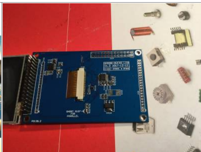
OVI40 3.5,, display, component side