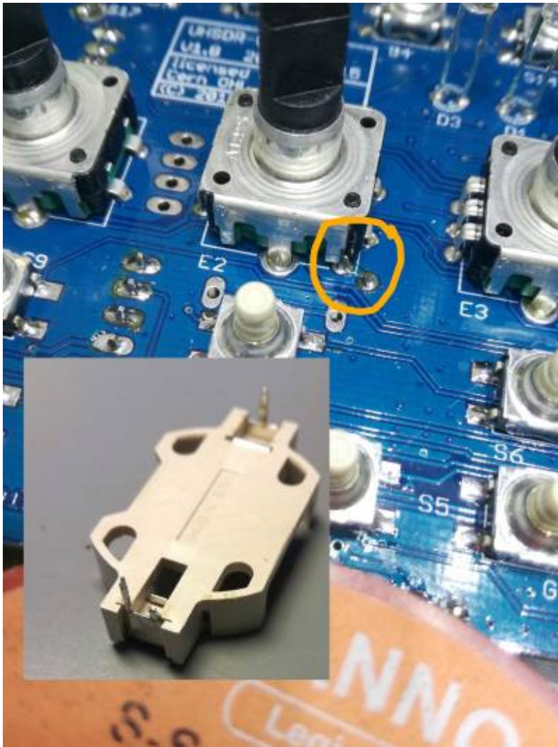
Möglicher Kurzschluß