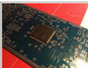
UI V1.8 PCB