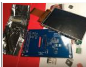
Display board