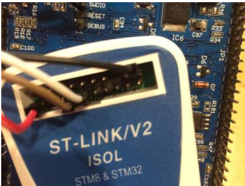
ST-Link connection to UI board

One additional trick, when I first connected to the MCU, I got an error message « Readout Protection Mode » and was unable to erase the chip. I finally choosed to try to flash a first time and the utility did what was necessary to remove the protection mode. Cool, thank you STM !