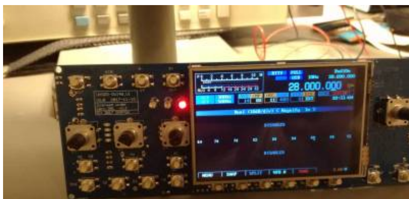
OVI40 UI and display board (photo DF9EH)